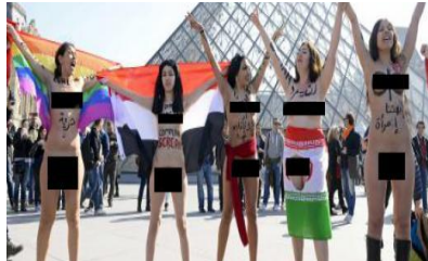
تصویری از زنان برهنه حزب ضد کارگری پیروان حکمت در فرانسه در مبارزه علیه مذهب و حجاب اجباری

مبارزه با مذهب مبارزه با نادانی و جهل عمومی است و این امری نیست که در طی ده ها سال ... عملی باشد. به این جهت کمونیستها همیشه مبارزه با مذهب را در متن مبارزه طبقاتی دیده و از دریچه منافع مبارزه طبقاتی به آن برخورد کرده اند. کارکارگر نماز خوانی که در تظاهرات و اعتصاب شرکت می کند و قرآن کوچکی در جیب دارد صدها بار ارزش و تأثیرش برای مبارزه بیشتر از یک روشنفکر ژیکولوئی است که در کافه ای در اروپا نشسته میگساری کرده و قرآن را آتش می زند و بر ضد پیامبر اسلام به عنوان فرد تروریست اعلامیه پخش می کند. یک زن نماز خوان کارگر محببه که در تهران جلوی درب وزارت کار و امور اجتماعی می ایستد و برای حقوقش دوشادوش مردان کارگر میرزد هزار بار تأثیرش بیشتر و مفید تر از آکسیون زنان برهنه حزب اسرائیلی ضد کمونیست کارگری و ضد ایرانی است که پرچم ایران را به زیر نافش پیچیده و عورتش را به نمایش گذاشته است.