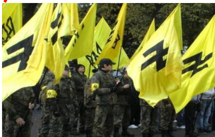
رژه نئونازیستها در اوکراین